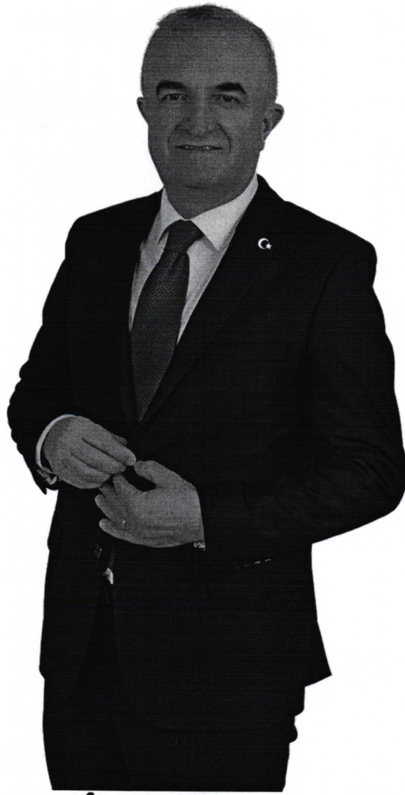
Hasan Fehmi TAŞ DADAY BELEDİYE BAŞKANI