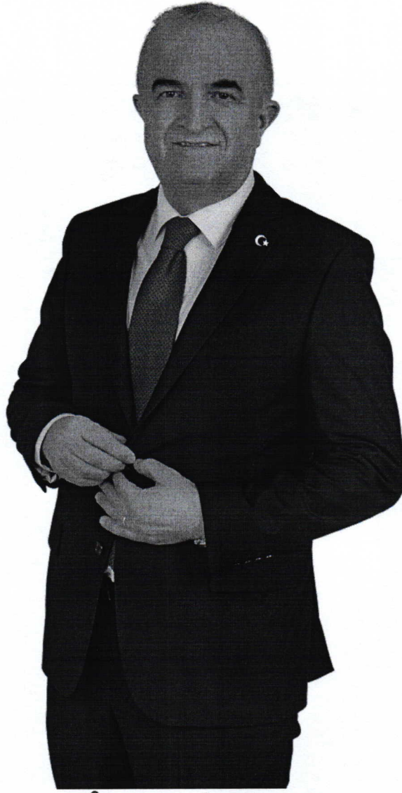
Hasan Fehmi TAŞ DADAY BELEDİYE BAŞKANI